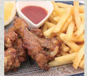
スパイシーチキン&ポテト…1,010円