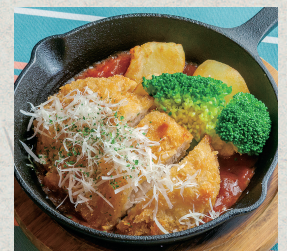
三元豚カツレツ…900円