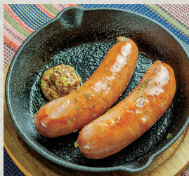
ソーセージグリル…650円