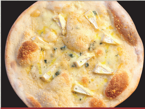
クアトロフォルマッジ…1,500円