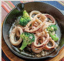
イカのガーリックソテー…790円