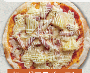
じゃがマヨベーコン