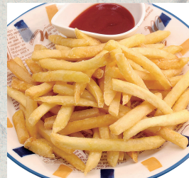
フライドポテト…380円