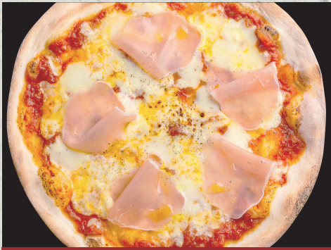
生ハムとモッツアレラのピッツァ…1,390円

薄くてパリパリカリカリした 食感が特徴の「ローマ風ピッツァ」 生地が割と薄いので意外とペロッと 1枚食べられちゃいます