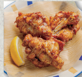
骨付きスパイシーチキン…720円