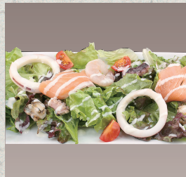
シーフードサラダ…920円