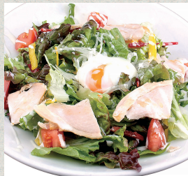
取り分けシェフサラダ…980円