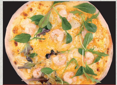
海老のオマールクリームピッツァ…1,500円