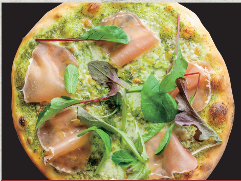
生ハムとモッツアレラのバジルピッツァ…1,500円