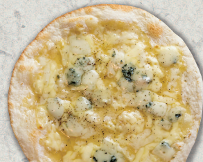
はちみつとブルーチーズ