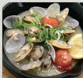
あさりの白ワイン蒸し…880円