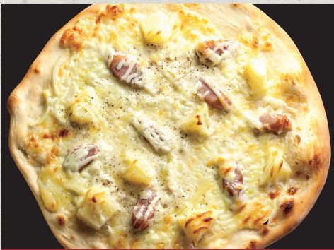
ジャーマンポテト…1,290円