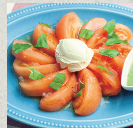
マスカルポーネチーズのカプレーゼ...790円