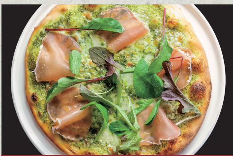
生ハムとモッツアレラのジェノベーゼピッツァ…1,410円