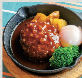
デミグラスソースハンバーグ...880円