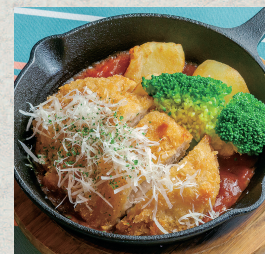
三元豚カツレツ...880円