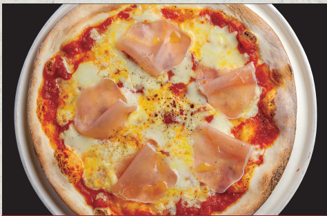
生ハムとモッツアレラのピッツァ…1,310円