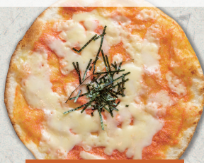
明太子マヨネーズ