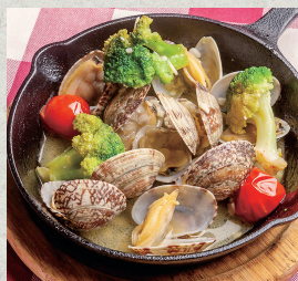
あさりの白ワイン蒸し...880円