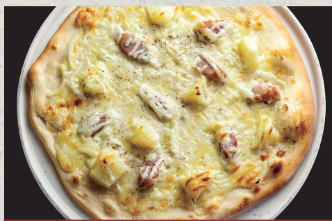
ジャーマンポテト…1,230円