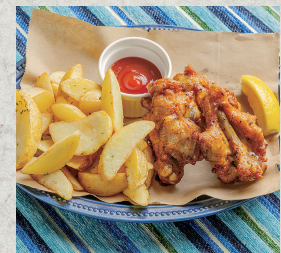
スパイシーチキン&ポテト...920円