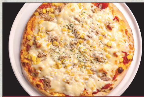
ツナマヨコーン…1,130円