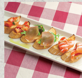
彩りブルスケッタ...790円