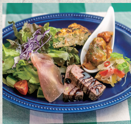
前菜とサラダ盛り合わせ...860円