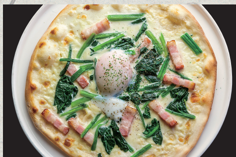
ベーコンとほうれん草のカルボナーラ風ピッツァ…1,280円