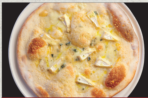
クアトロフォルマッジ…1,430円