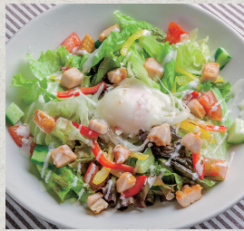
グランデ! 取り分けシェフサラダ...980円