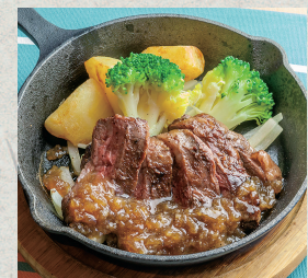
牛ハラミのタリアータ...930円