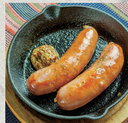
ソーセージグリル...580円