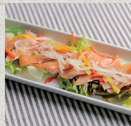
スモークサーモンのカルパッチョ...830円