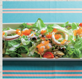
シーフードサラダバジルソース添え...980円