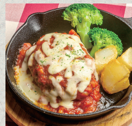
イタリアンハンバーグ...880円