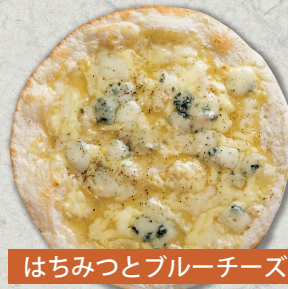
はちみつとブルーチーズ