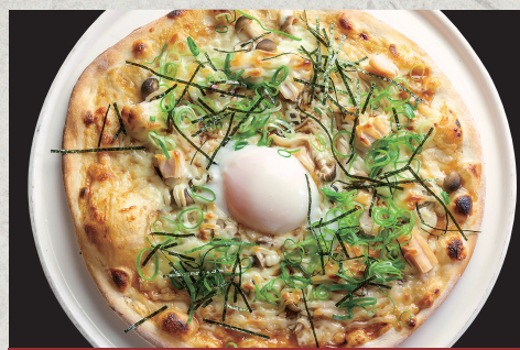
チキンと温泉卵の照り焼きマヨ…1,210円